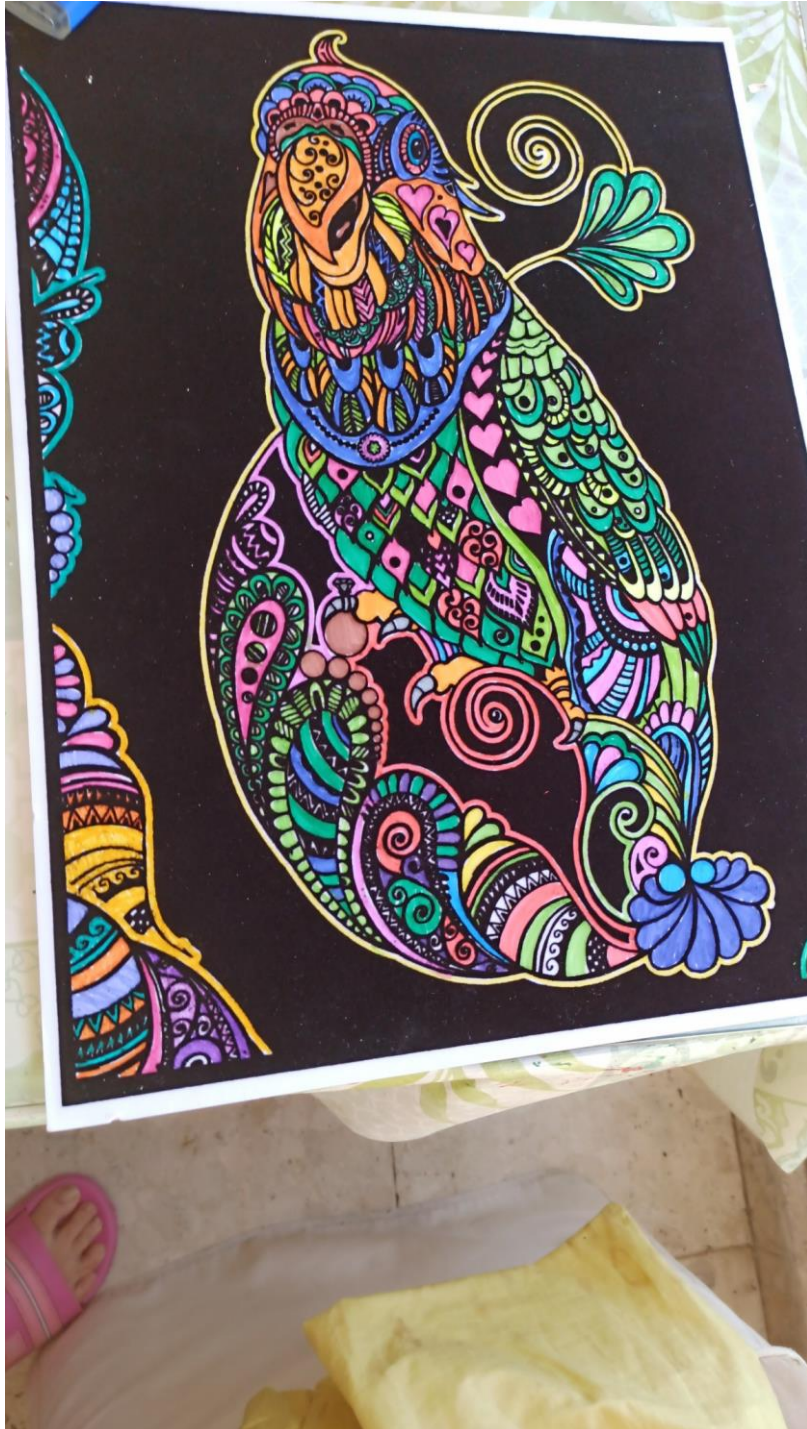
LORO LORITO QUE VENGA EL DINERITO